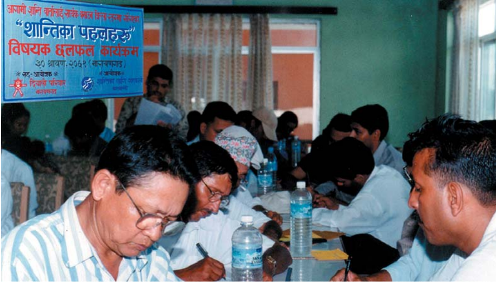
२०६१ साउन ३० गते शान्तिका लागि सहकार्य र दिवालो परिवारद्वारा संयुक्त रूपमा नारायणगढमा आयोजित अन्तर्क्रिया कार्यक्रमको एक छलक।

शान्तिका लागि सहकार्यद्वारा प्रकाशित त्रैमासिक बुलेटिन