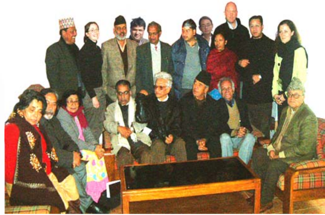
२०६३ माघ २१ र २२ गते सम्पन्न रणनीतिक योजना बैठकमा सहभागी शान्तिका लागि सहकार्य र इन्टरनेशनल एलर्टका सदस्यहरू

द्वन्द्वको बदलिदो परिवेशमा पनि आवश्यक सूचना र विशेषज्ञताका लागि यो संस्था सार्वजनिक स्रोतको रूपमा रहिरहेको छ। यसले द्वन्द्व व्यवस्थापन र शान्ति स्थापनाका नयाँ अवसरहरूको खोजी गर्ने कामलाई निरन्तरता दिँदै आएको छ। यस संस्थाले विविध राष्ट्रिय तथा अन्तर्राष्ट्रिय संस्थाहरूसँग निरन्तर सहकार्य गर्दछ।